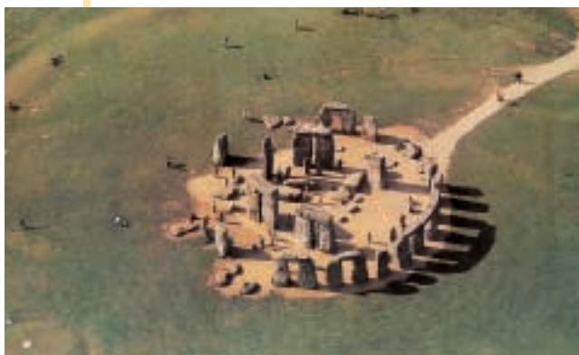
Circolo megalitico di Stonehenge

Il sud-est termina con lo Stretto di Dover ; da qui parte l'eurotunnel, un canale che passa sotto il mare e che unisce l'Inghilterra alla Francia.