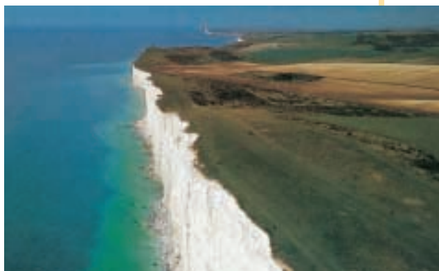
Scogliere a Dover